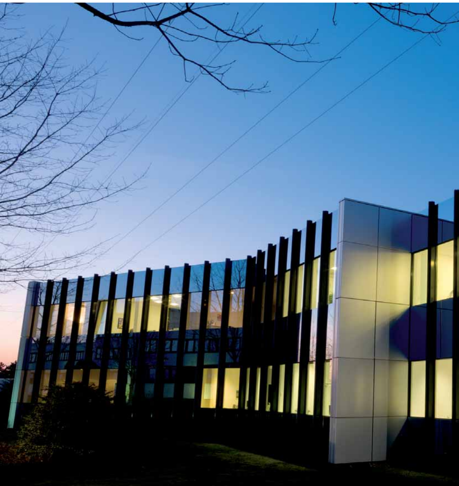
Gebäude der EHLEBRACHT AG, 32130 Enger